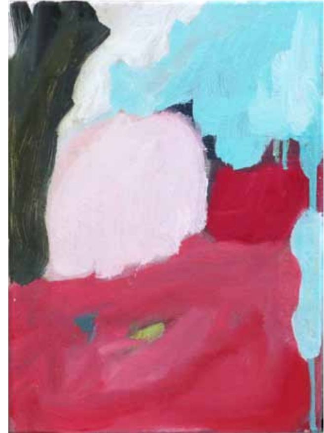
Six hour work day

”Niin kauan kuin haen onnea itselleni, en sitä koskaan löydä. Jos pyrin vain selville pääsemiseen oman itseni iloksi, se osoittaa, etten ole päässyt selville alkuunkaan. Selville pääsemistä seuraa itsestään myötäelämisen kyky. Ihminen elää toista ihmistä,