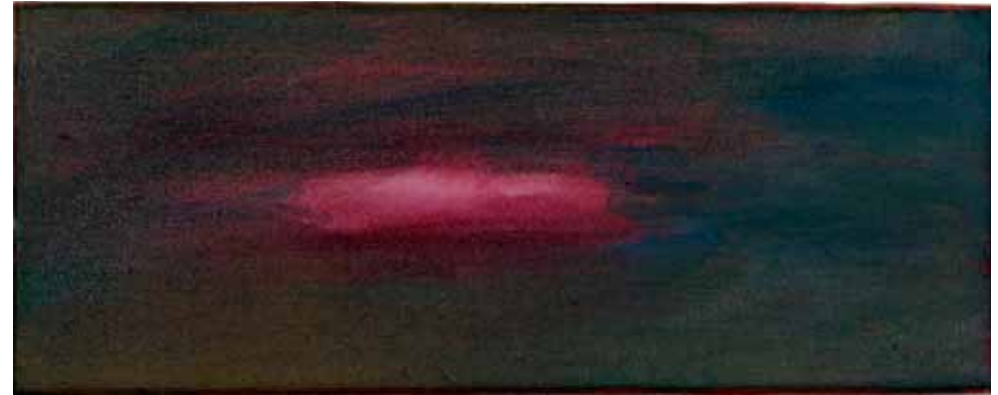
Tänään, sarjasta AIKA 2017, öljy kankaalle, 15,5 x 40 cm