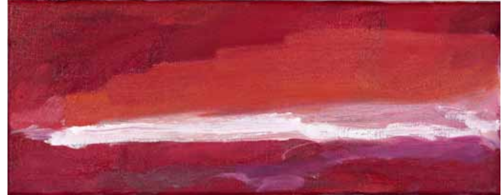
Eilen, sarjasta AIKA 2017, öljy kankaalle, 15,5 x 40 cm