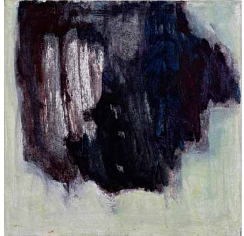
Magnus Lindberg; Clarinet concerto 2014, öljyväri kankaalle, 30 x 30 cm

Löydän tästä työstä toisen ihmisen, kasvot ja kaikki, vaaleana heijastumana tai hahmona tummassa musiikin virrassa. Haluaisin peilata itseäni siihen ihmiseen. Olisin ihan itseni kokoinen, pieni ja epämääräinen. Kuten se hahmokin musiikin sisällä.