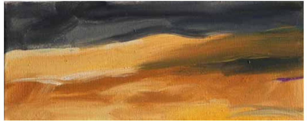
Ylihuomenna, sarjasta AIKA 2017, öljy kankaalle, 15,5 x 40 cm