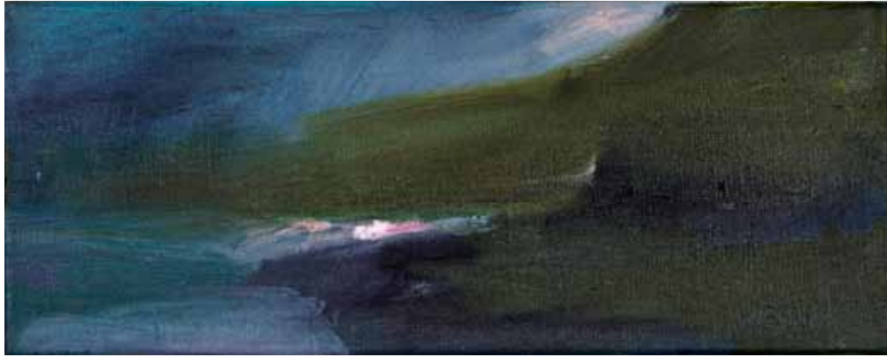
Huomenna, sarjasta AIKA 2017, öljy kankaalle, 15,5 x 40 cm