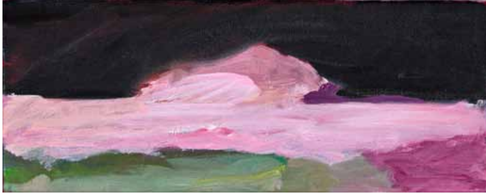
Toissapäivänä, sarjasta AIKA 2017, öljy kankaalle, 15,5 x 40 cm